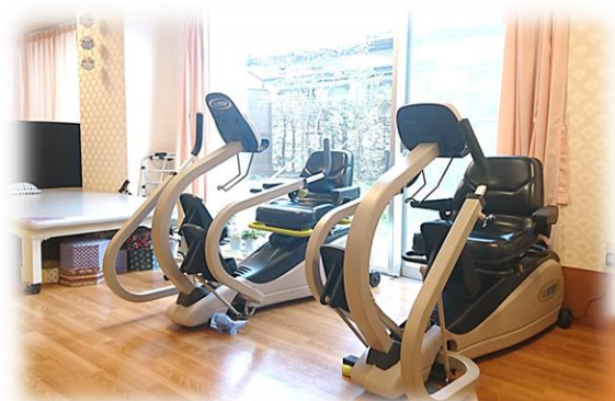
高齢者のリハビリに 最適な全身運動器