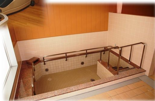
温泉入浴 (源泉名：不動温泉百万石)